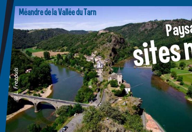
Méandre de la Vallée du Tarn