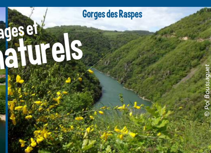
Gorges des Raspes