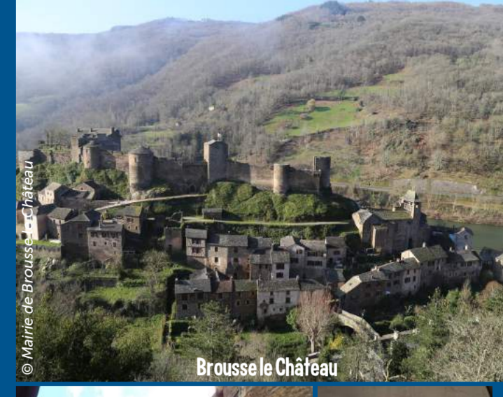
Brousse le Château